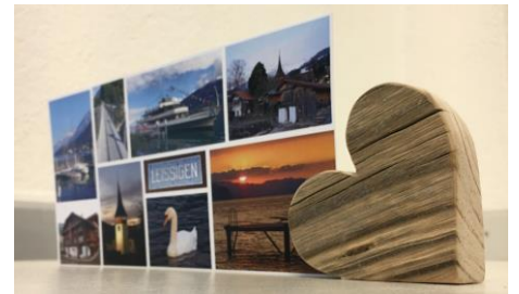
Papeterie und Holz

Das Atelier augenglück bietet Raum für schöne Dinge, die das Auge erfreuen und Gelegenheit für Begegnungen, die glückliche Erinnerungen schaffen. Fortlaufend bietet augenglück mit Liebe und Wissen Handgemachtes von Kunstschaffenden aus der Region und führt Kurse und Anlässe für Gross und Klein durch.