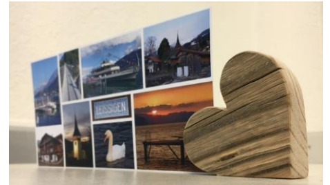
Papeterie und Holz

Das Atelier augenglück bietet Raum für schöne Dinge, die das Auge erfreuen und Gelegenheit für Begegnungen, die glückliche Erinnerungen schaffen. Fortlaufend bietet augenglück mit Liebe und Wissen Handgemachtes von Kunstschaffenden aus der Region und führt Kurse und Anlässe für Gross und Klein durch.