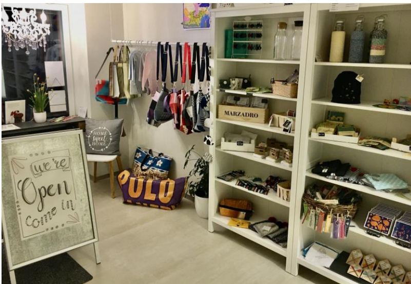
Stöbern in gemütlicher Atmosphäre